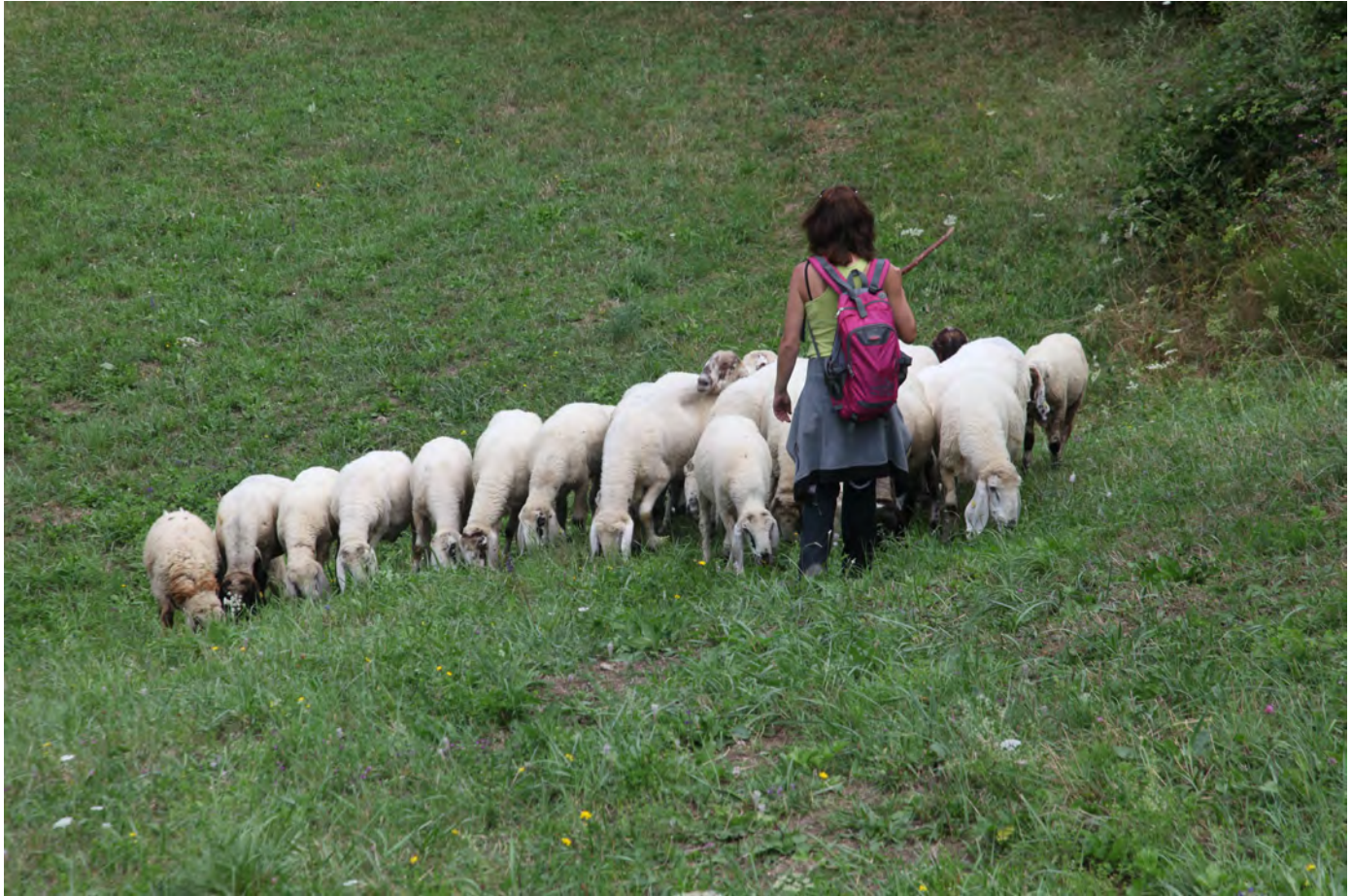
Pastora a Corniglio, Parma. Superterra 2016