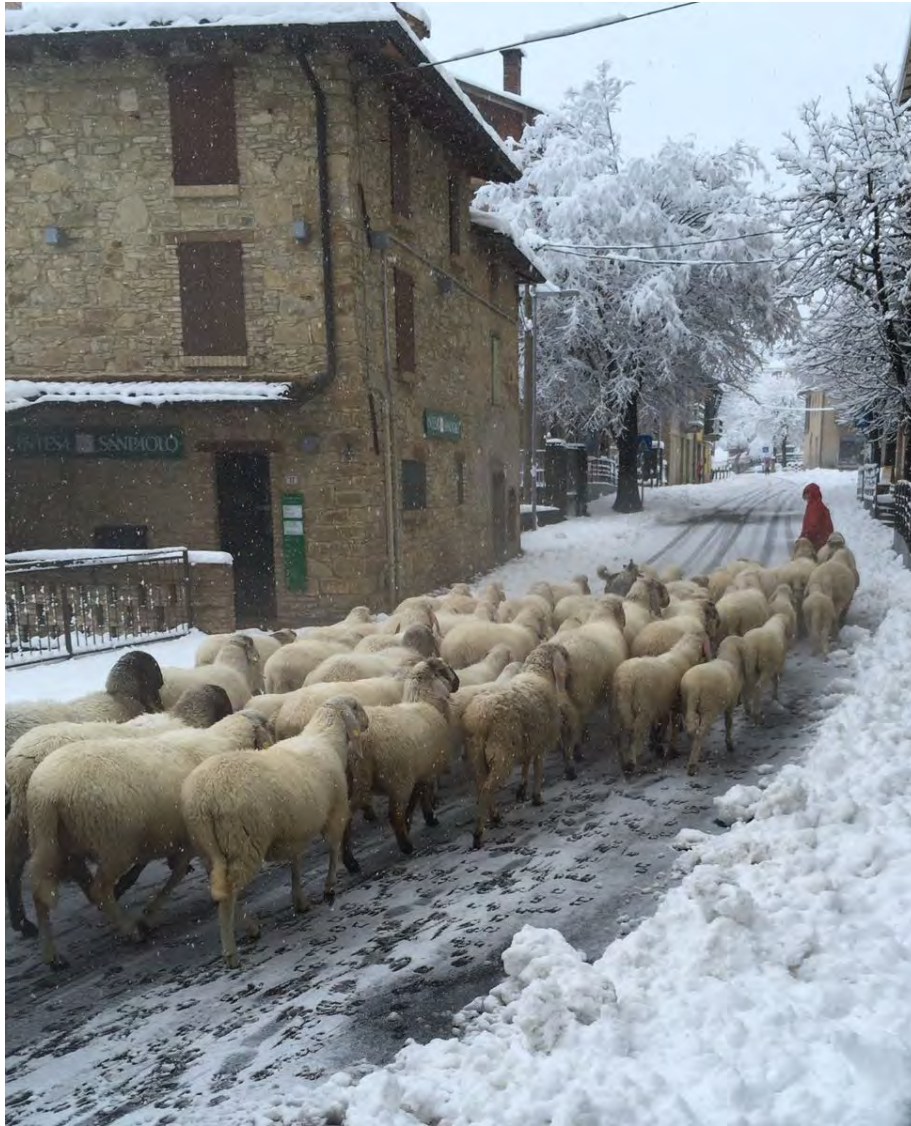
Il gregge dell'azienda agricola Pezza Rossa di Neviano degli Arduini