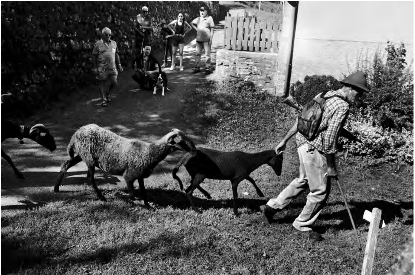
L'"avvio" della transumanza di Alfredo Marchetti, 2018