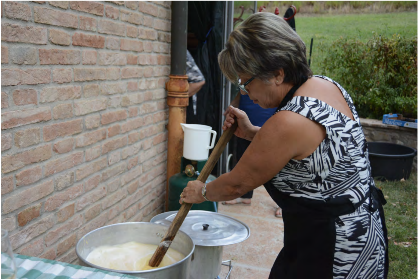
La preparazione della ricotta nell'azienda agricola Il pastore a Castelvetro. Superterra 2017