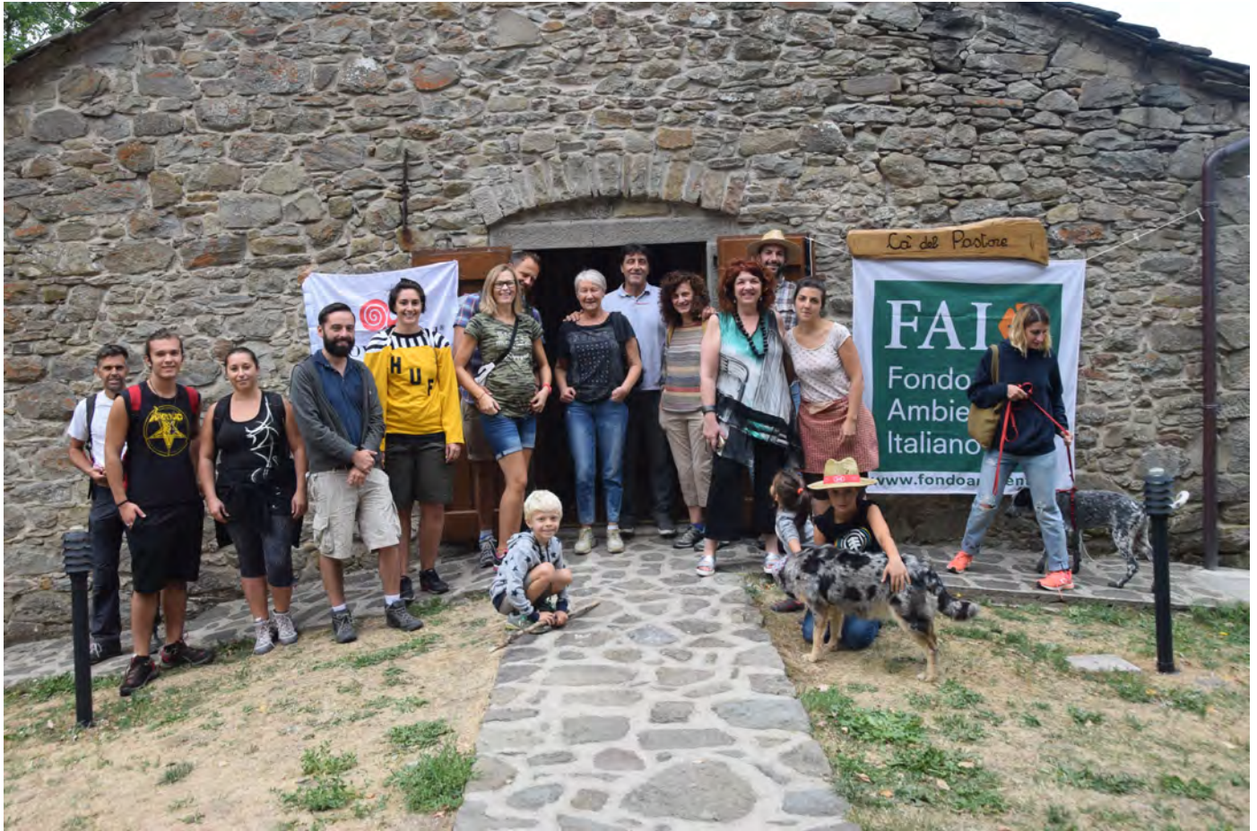
Ca' del Pastore alla Fattoria Campo delle Sore di Fiumalbo. Superterra 2017