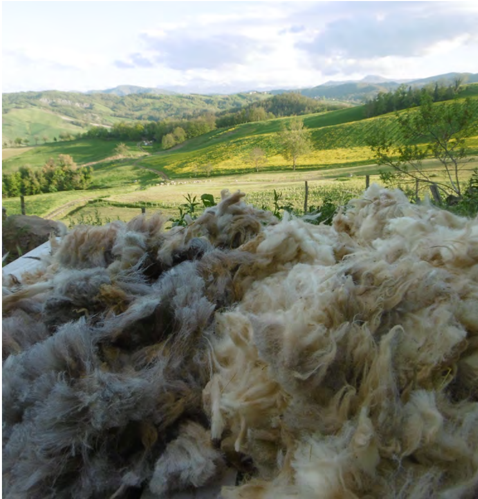
La lana biodiversa