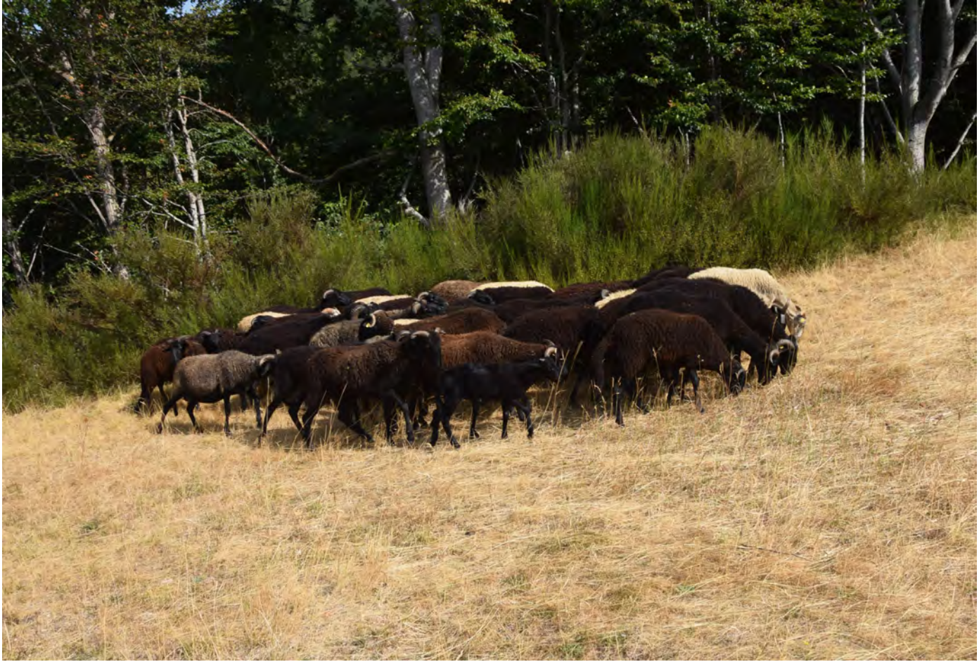
Pascolo estivo a Fiumalbo per il gregge della Fattoria Campo delle Sore. Superterra 2017