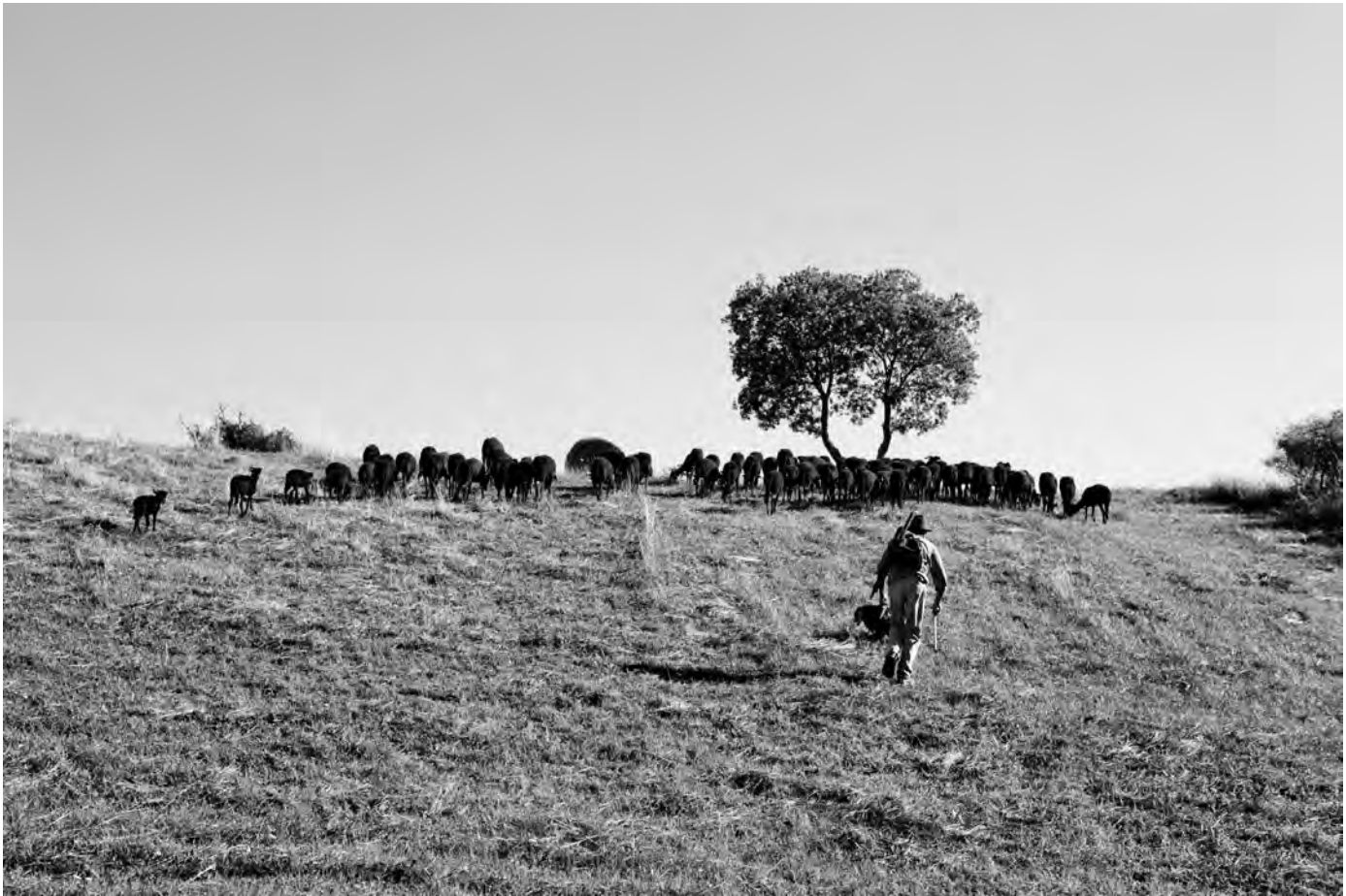
Alfredo Marchetti con il suo gregge di massesi durante la transumanza 2018n sui colli modenesi