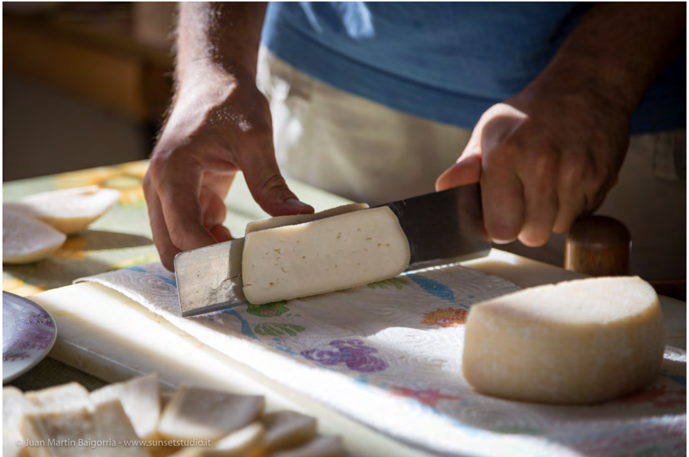
Pecorini della montagna romagnola, Tredozio. Superterra 2016