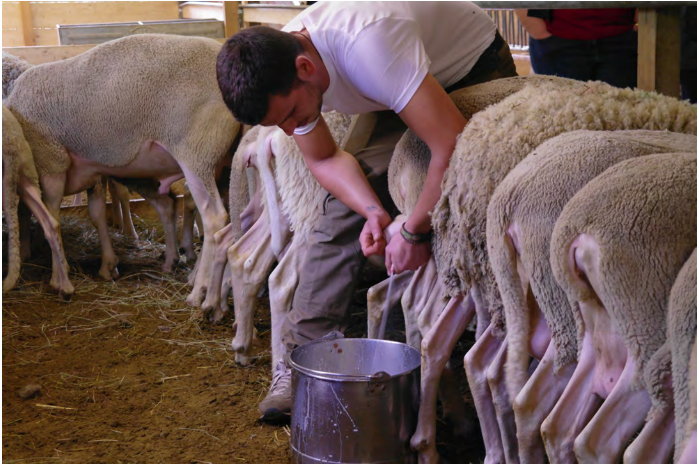
Dimostrazione di mungitura a mano nell'azienda agricola Caboi, Fontanelice. Superterra 2017