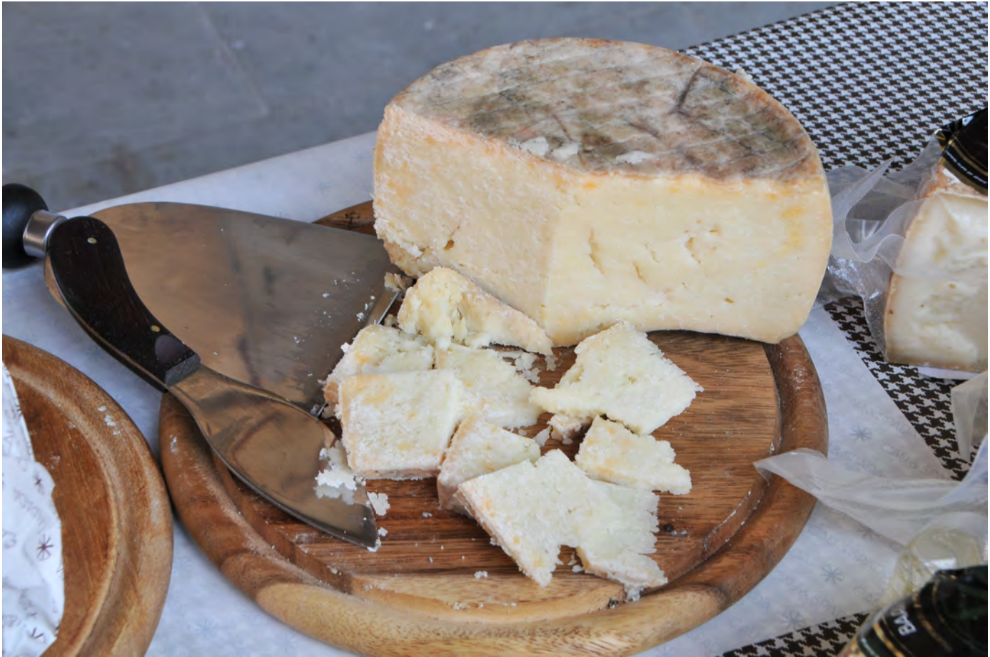
Pecorini dei colli riminesi.Viaggio verso Expo 2015