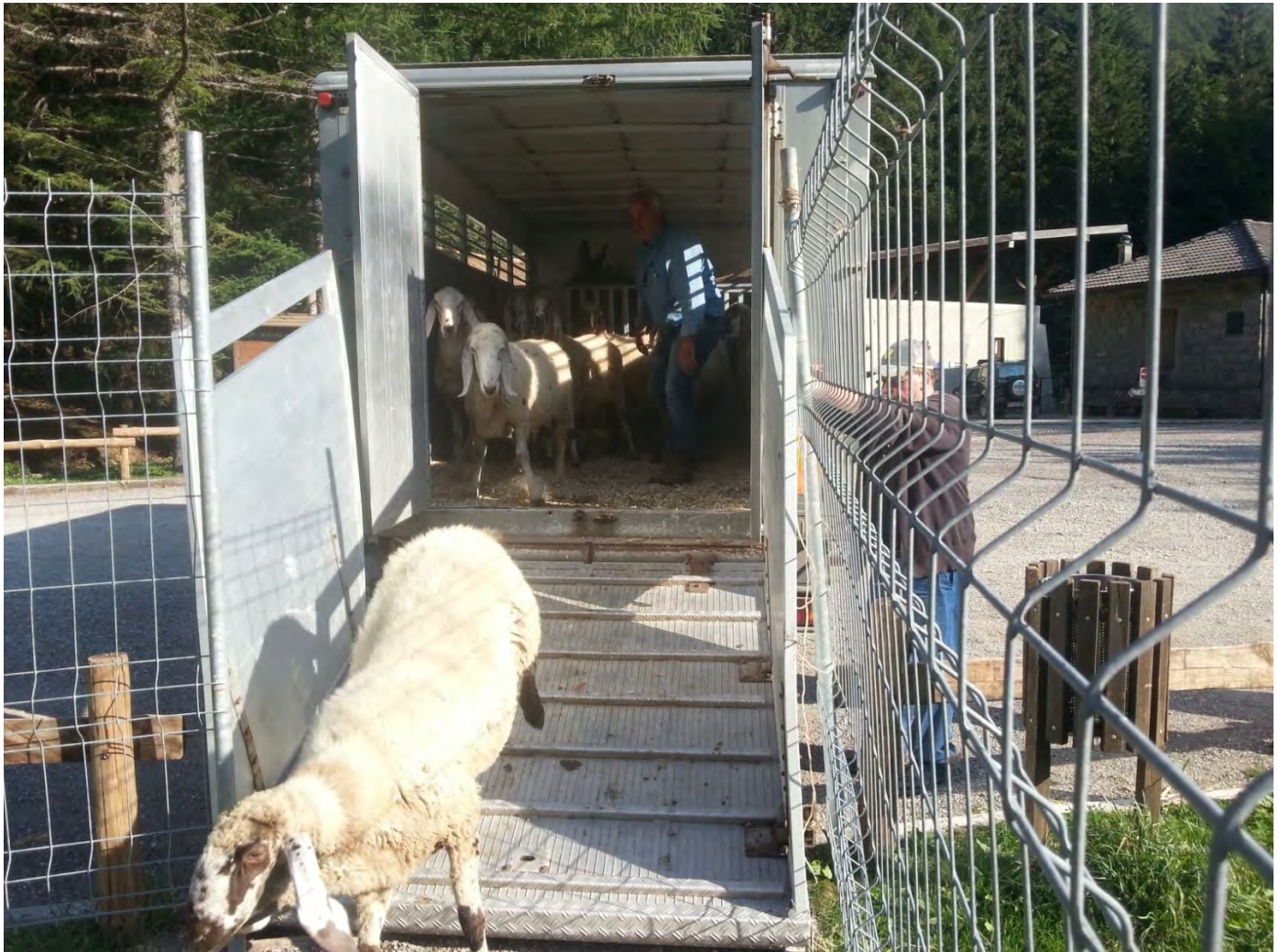
La transumanza di oggi con l'aiuto del camion. Viaggio verso Expo 2015