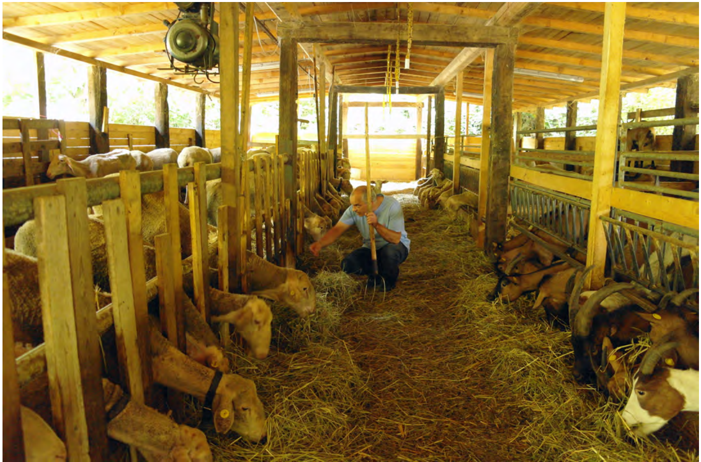
Ottavio Atzori nell'ovile della sua azienda agricola a Fontanelice, 2019