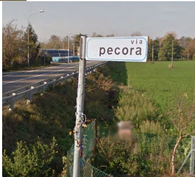
Borgo Confina (FE)