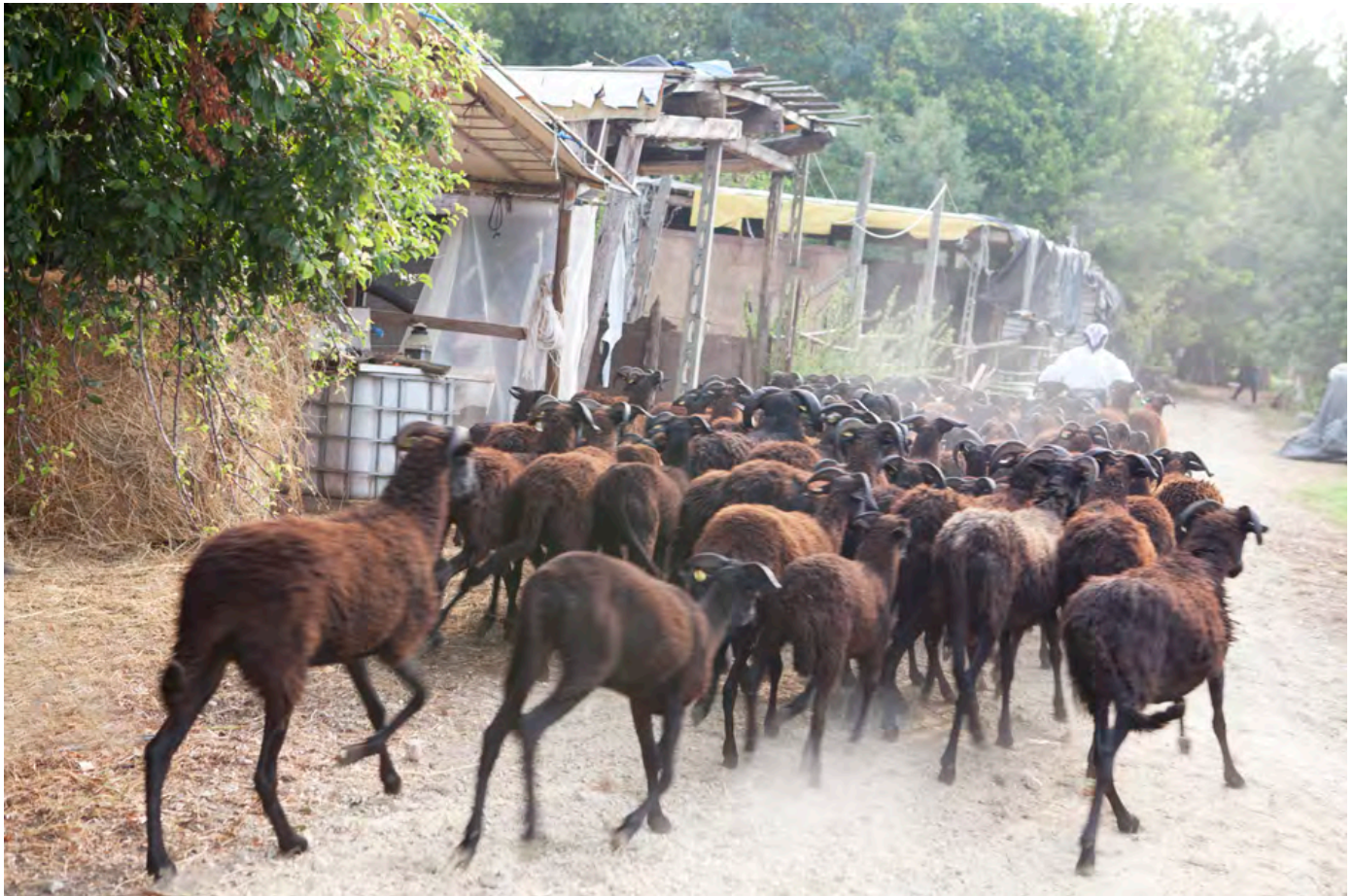
Il gregge di pecore massesi di Alfredo Marchetti a Bastia, 2019