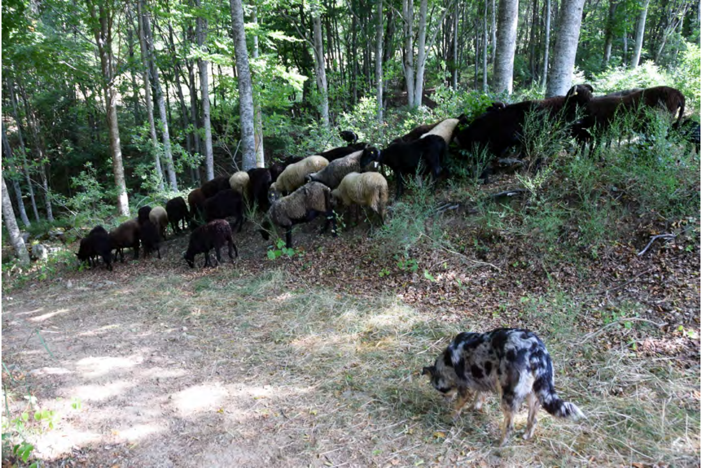
Il gregge della Fattoria Campo delle Sore scortato dal cane pastore nei boschi di Fiumalbo. Superterra 2017