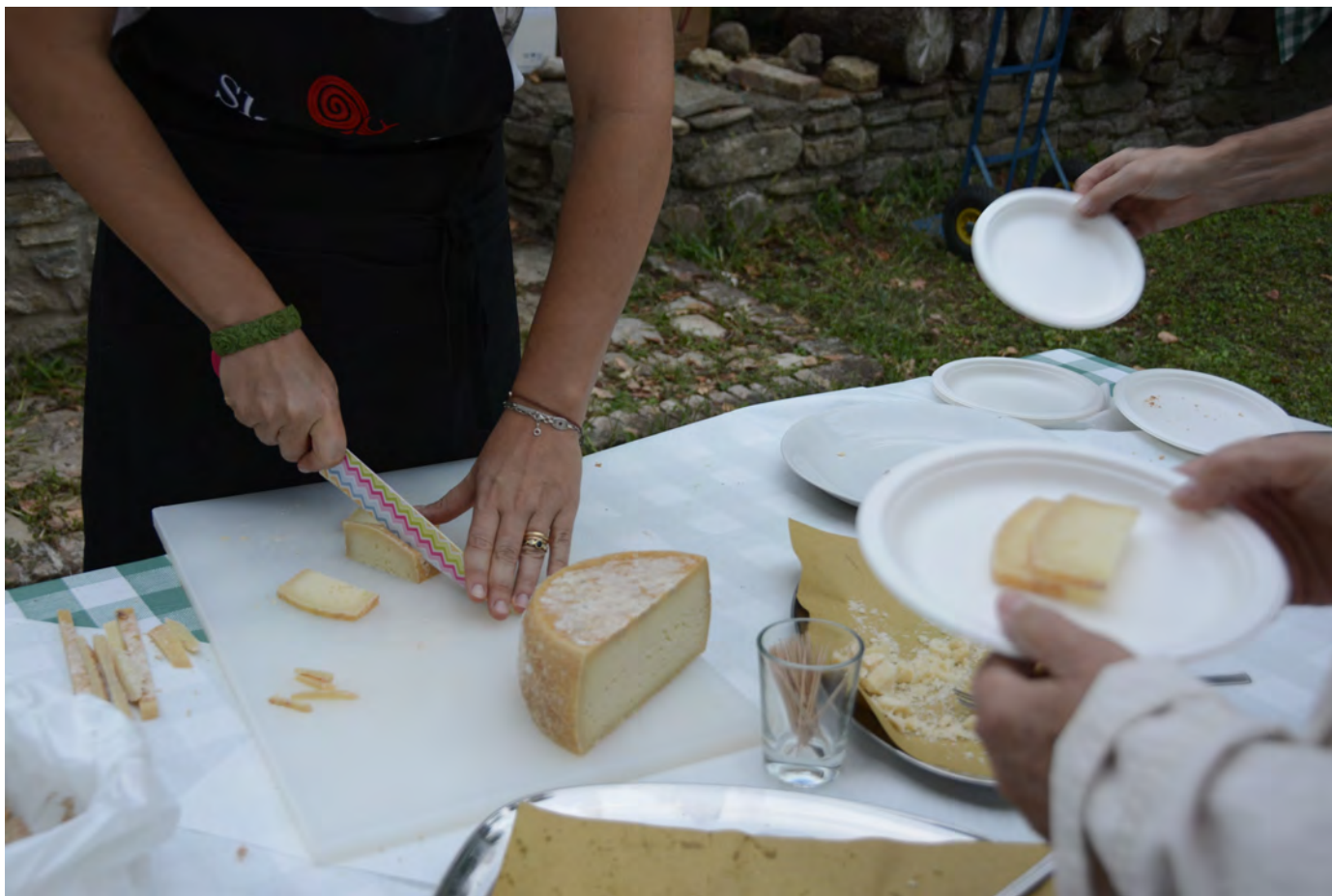
Pecorini del modenese, con Superterra 2017 a Castelvetro