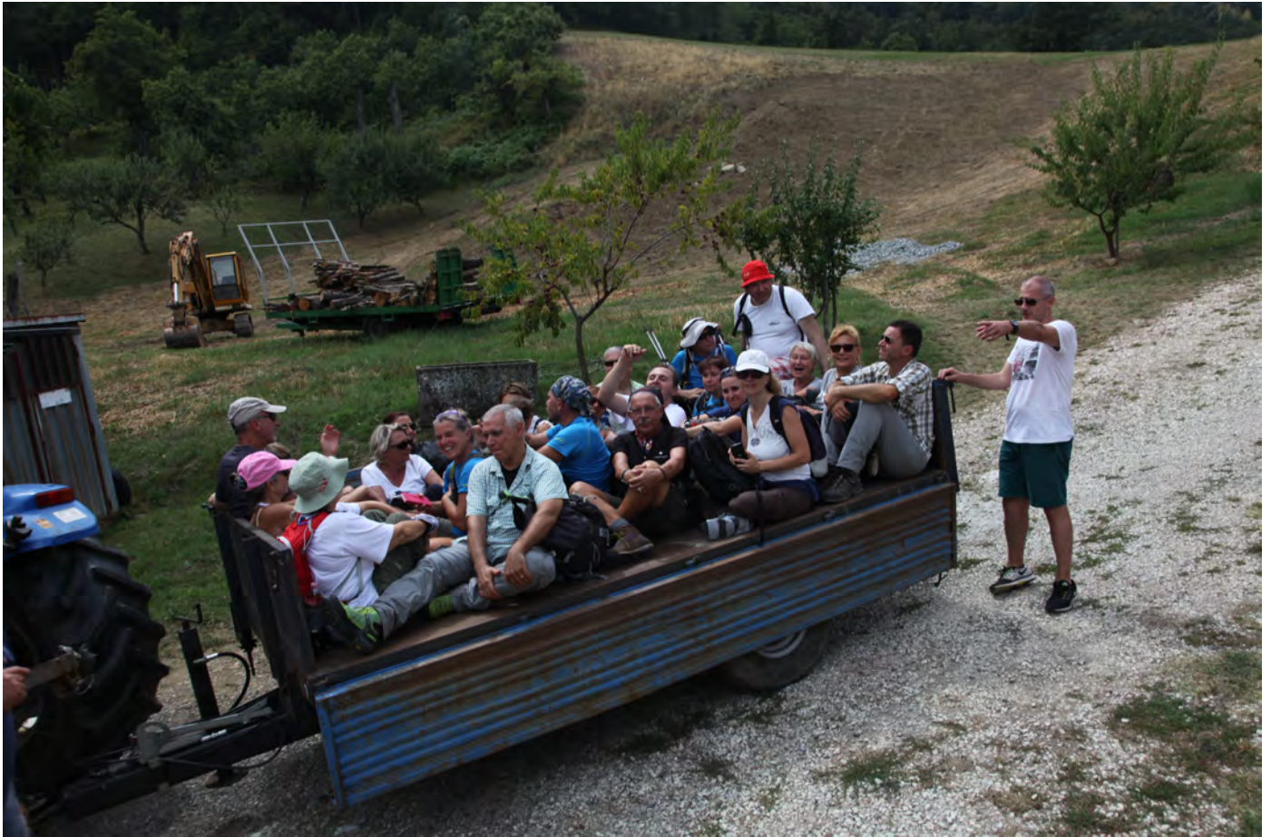
Nei campi sulle colline di Monghidoro. Superterra 2016