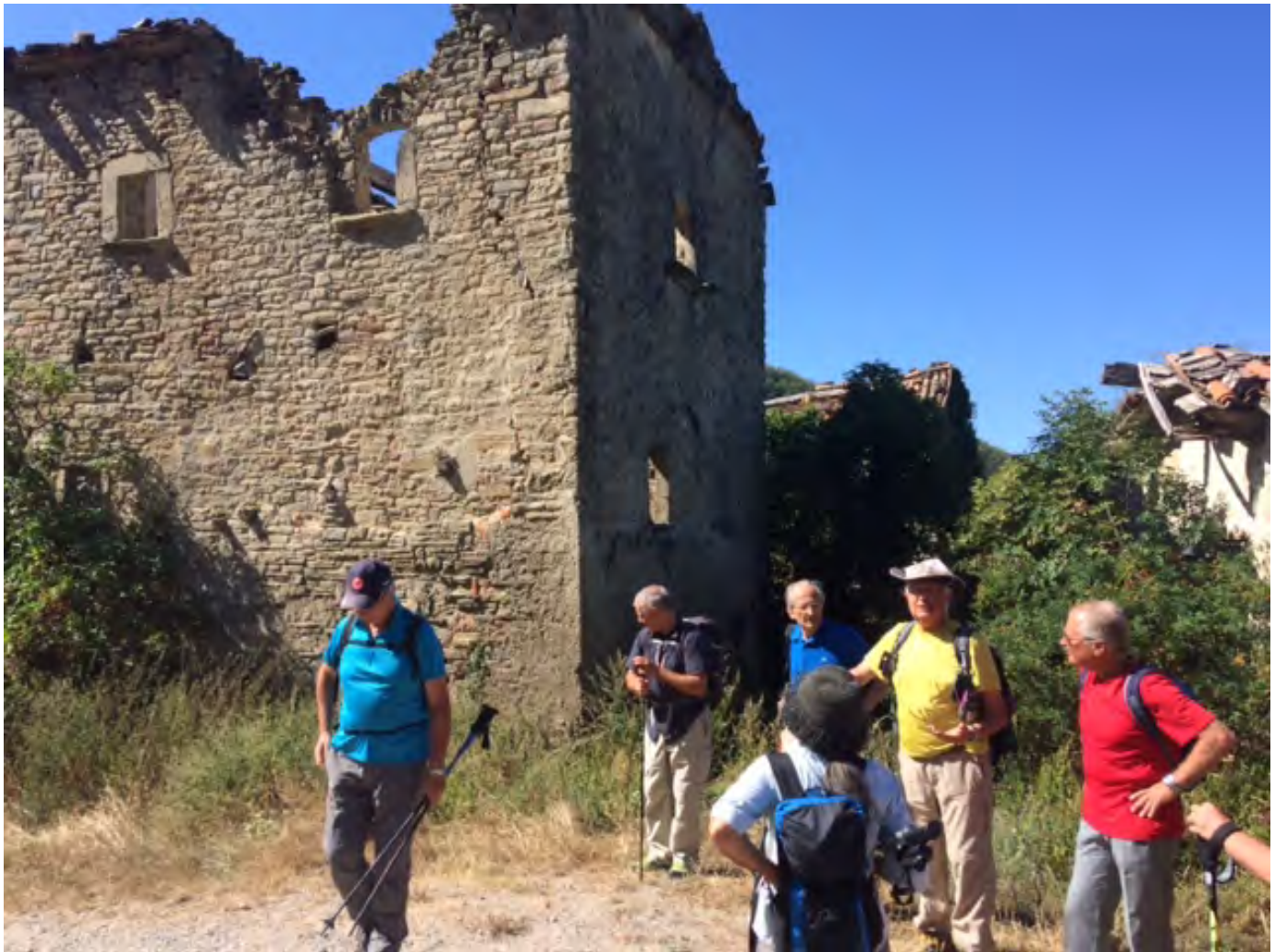
Tredozio. Superterra 2017