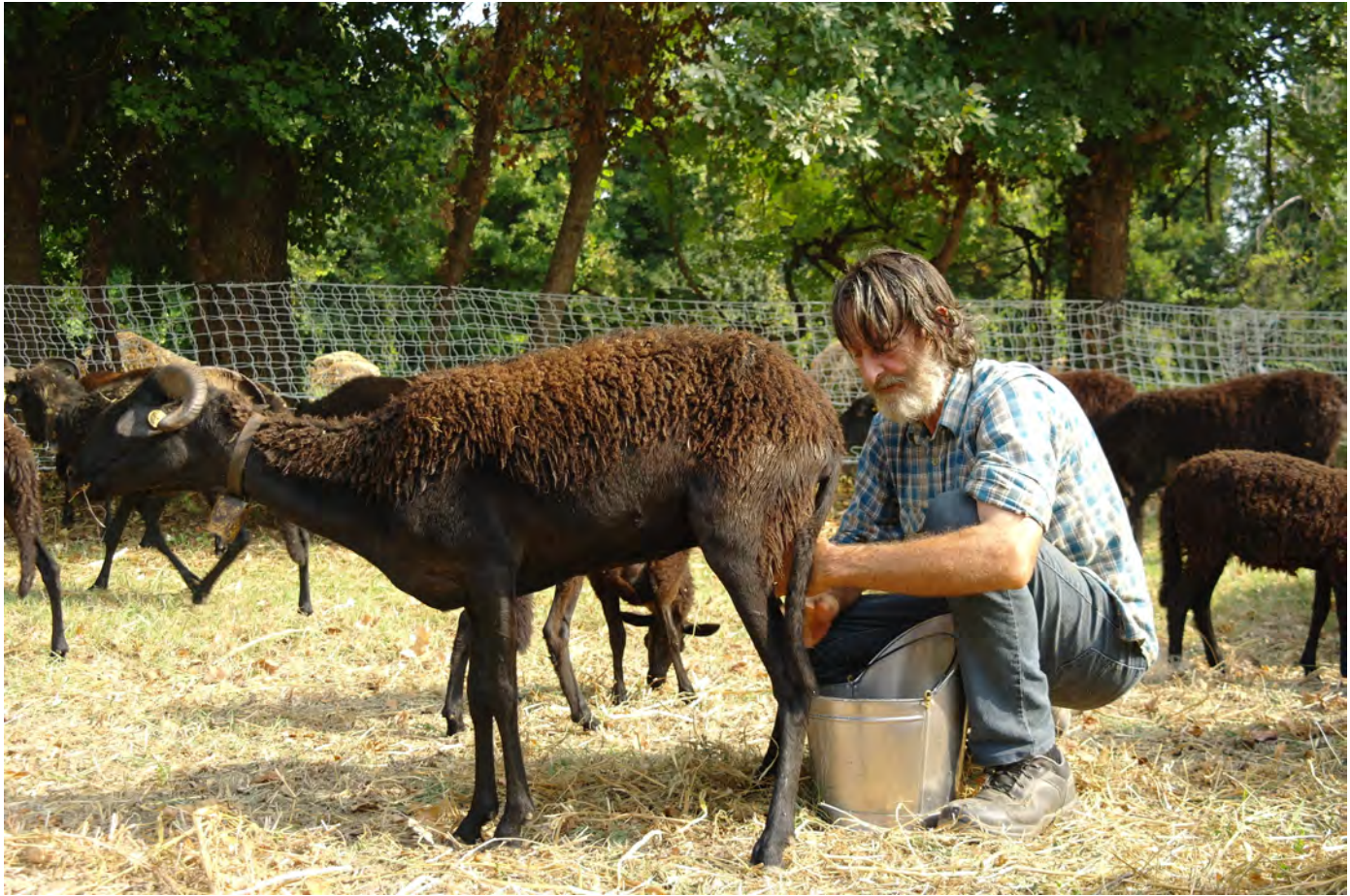
L'angolo della pastorizia transumante ricreato a Bastia: la mungitura alla rete, 2019