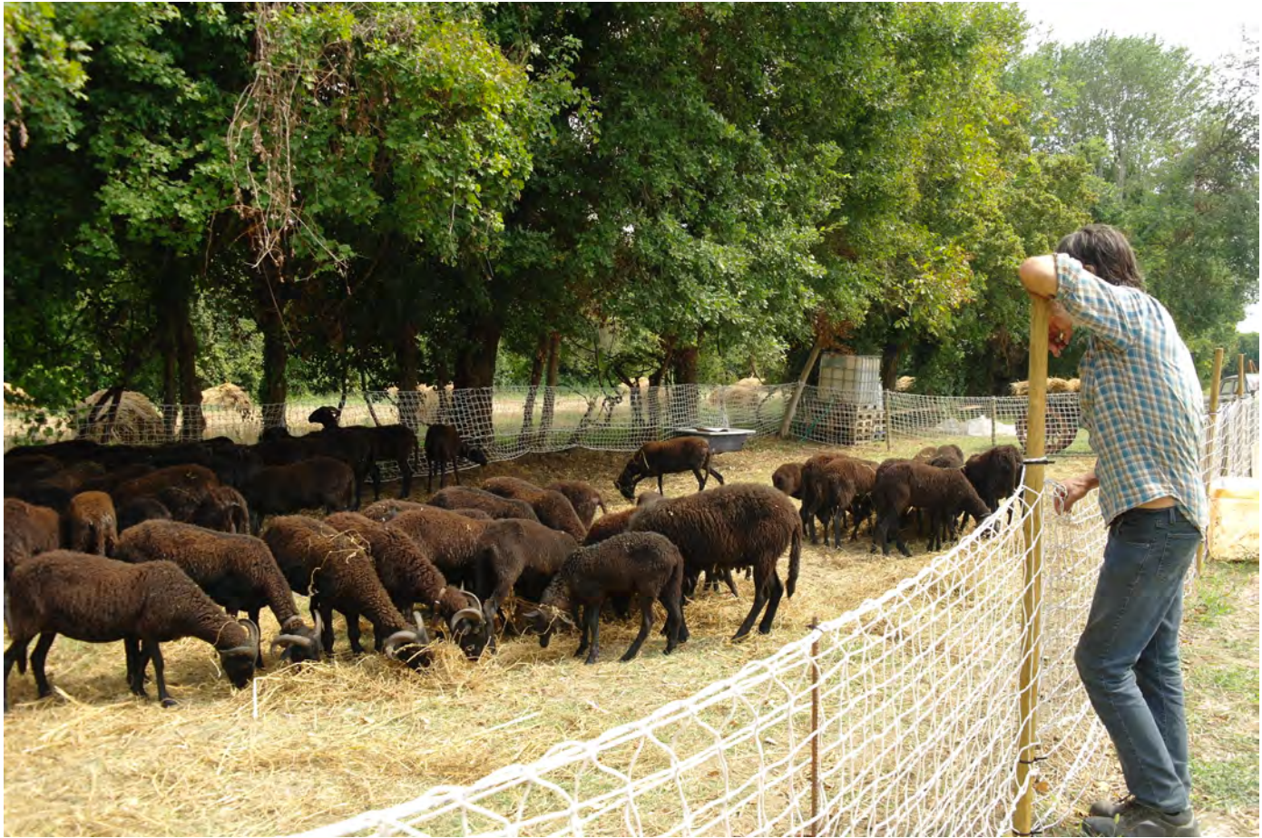
L'angolo della pastorizia transumante ricreato a Bastia: la posa della rete durante la sosta del gregge, 2019