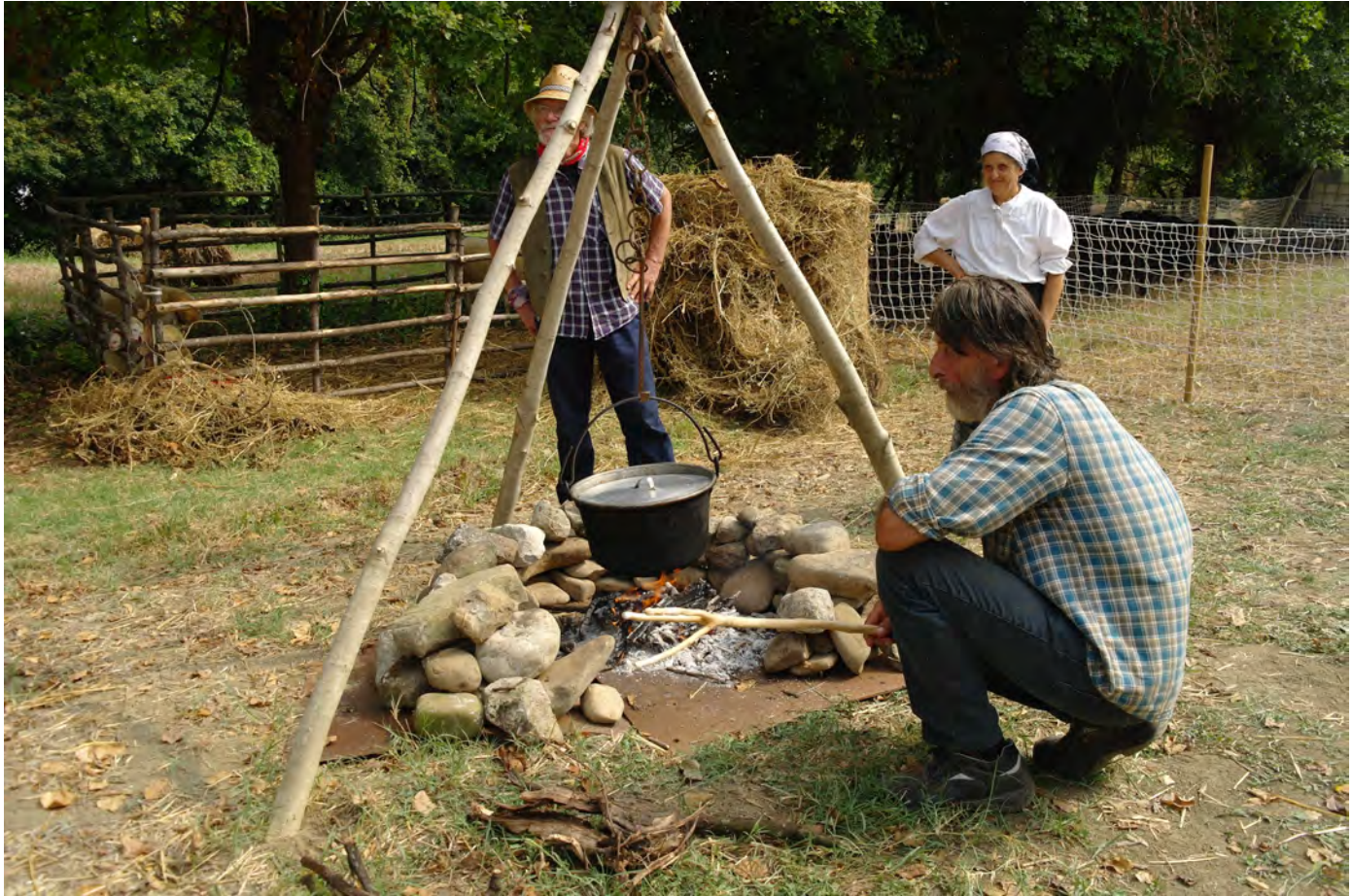
L'angolo della pastorizia transumante ricreato a Bastia: l'accensione del fuoco per fare il formaggio come i pastori di un tempo, 2019