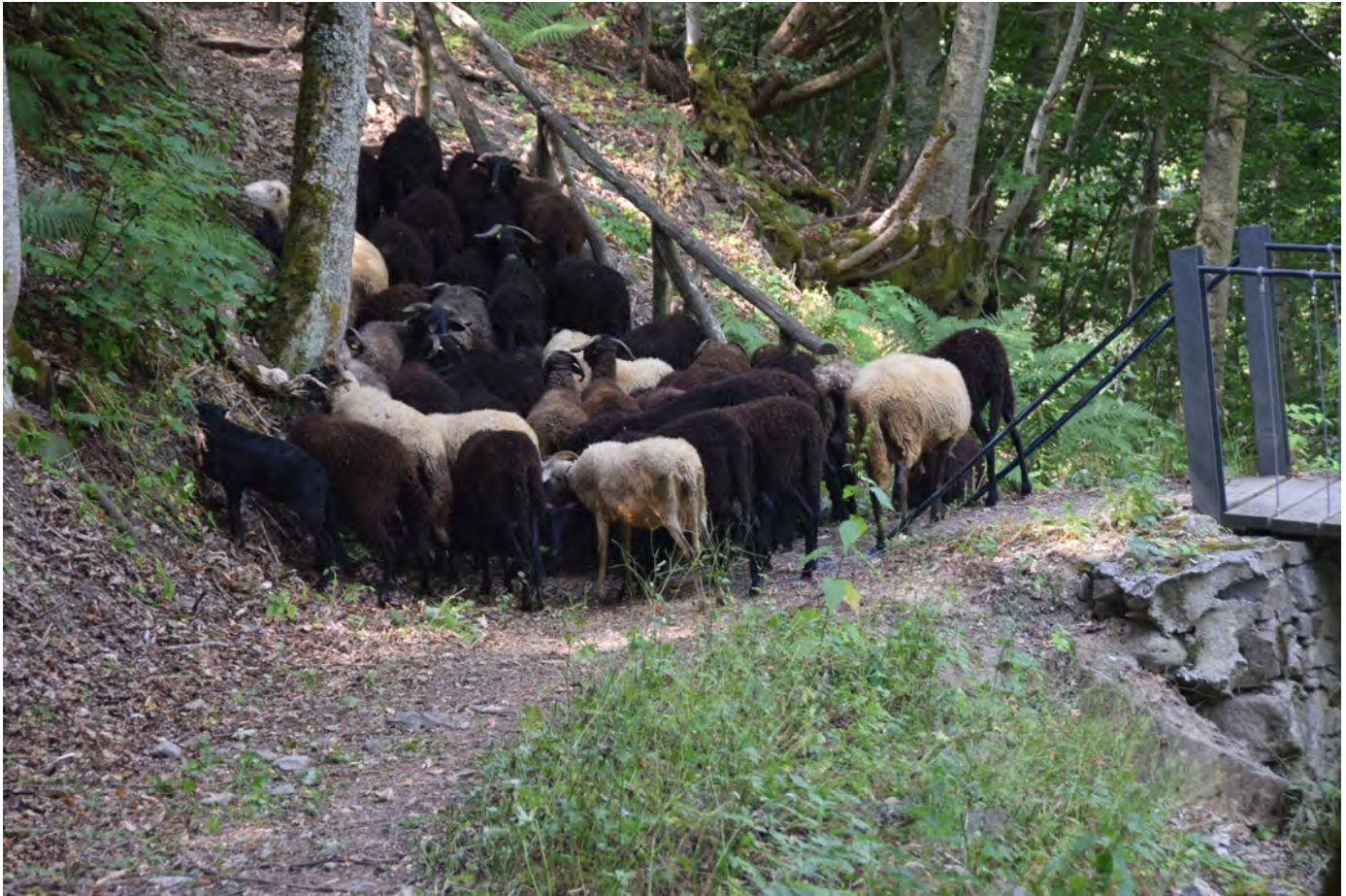
Nei pascoli di Fiumalbo. Superterra 2017