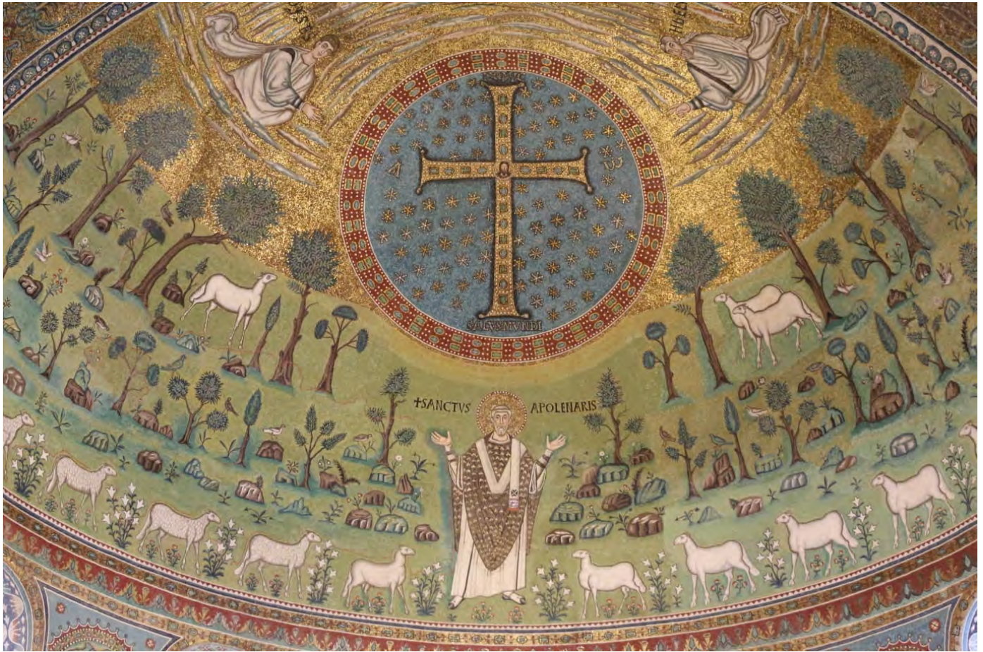
I mosaici di Sant'Apollinare in Classe a Ravenna