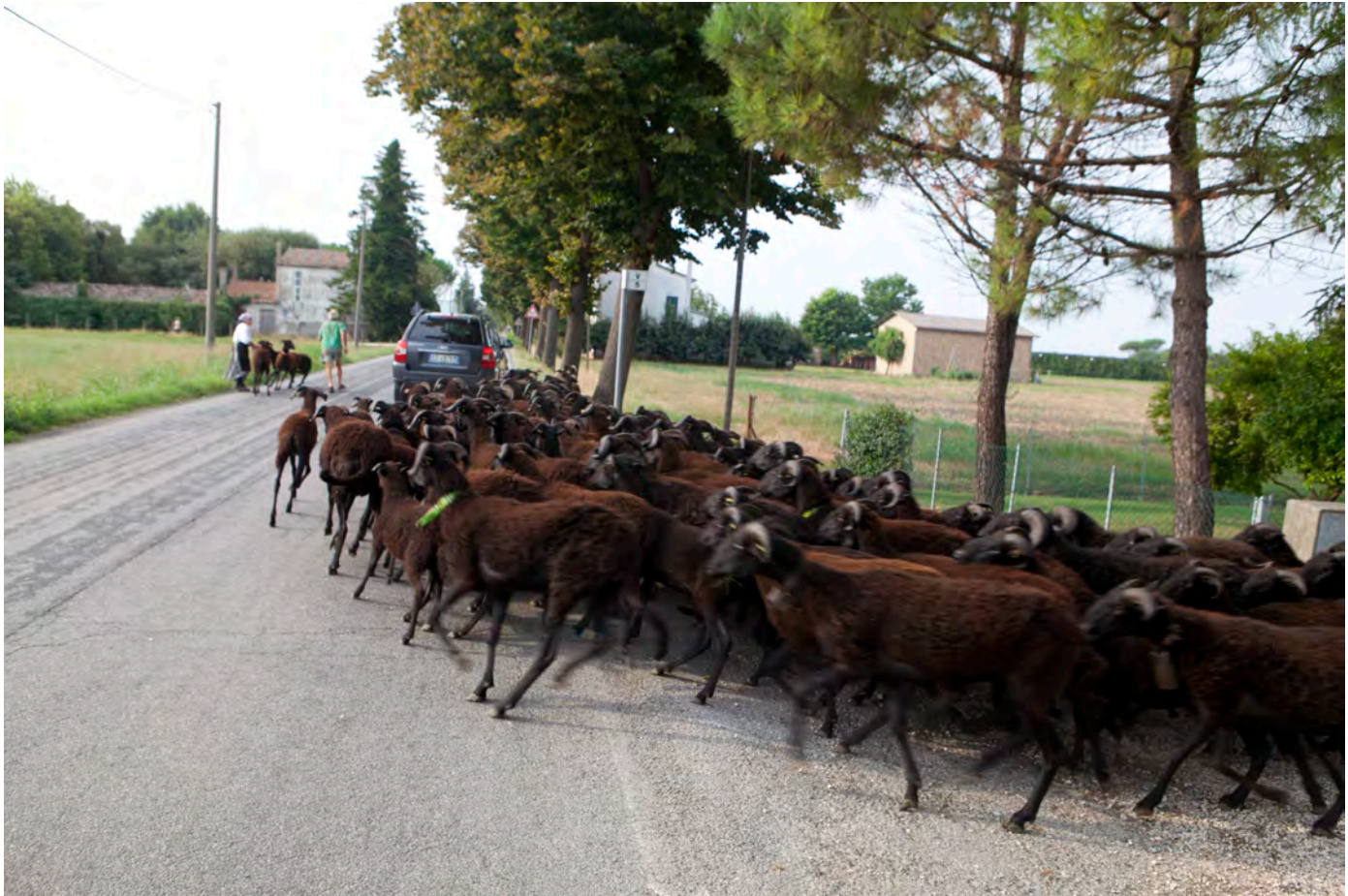
Il gregge di pecore massesi di Alfredo Marchetti a Bastia, 2019