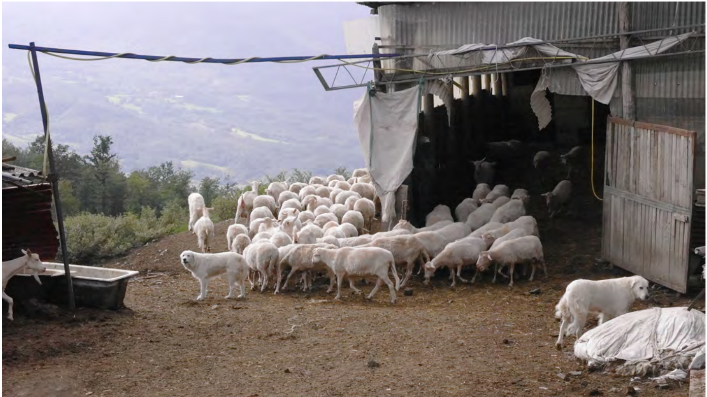
Ovile all'azienda agricola La Casaccia di Lizzano in Belvedere. Viaggio verso Expo 2015