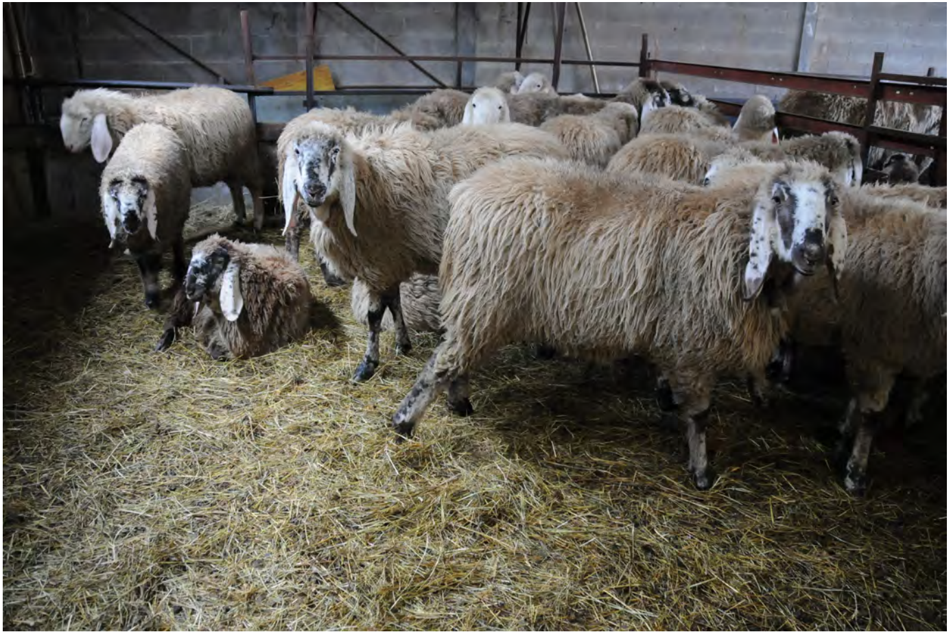
Pecora cornigliese