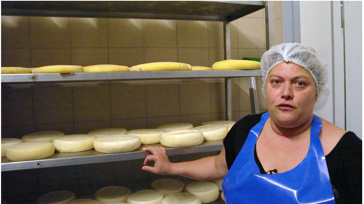
I formaggi dell'azienda agricola La Casaccia, Lizzano in Belvedere. Viaggio verso Expo 2015