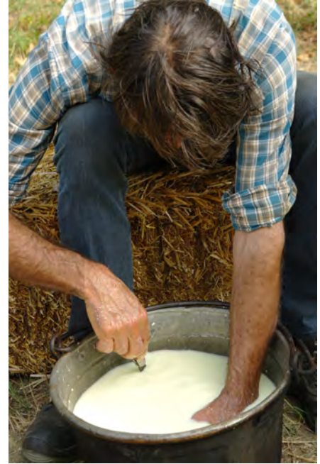
L'angolo della pastorizia transumante ricreato a Bastia: la rottura della cagliata e la separazione della cagliata dal siero e il taglio, 2019