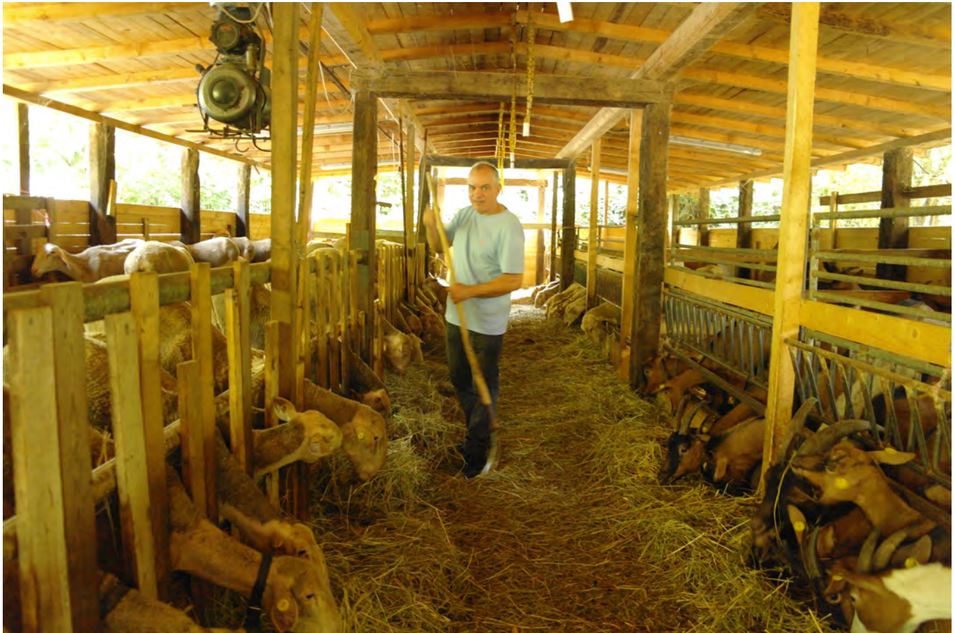
Ovile dell'azienda agricola Caboi, Fontanelice 2019