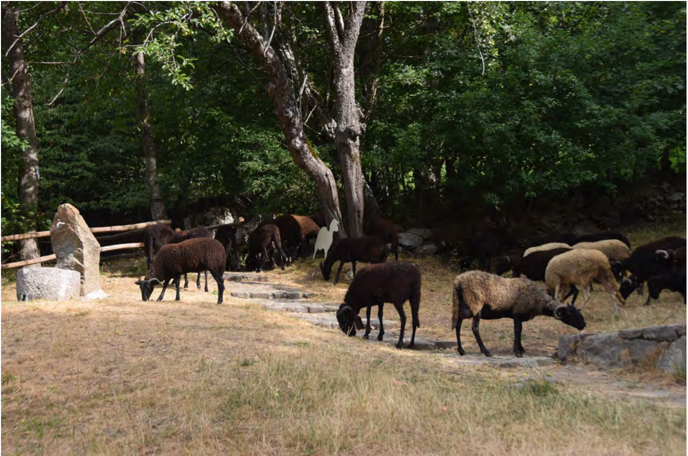
Il gregge di Fattoria Campo delle Sore di Fiumalbo al pascolo. Superterra 2017 (Foto di Francesco Paolo Vignocchi)