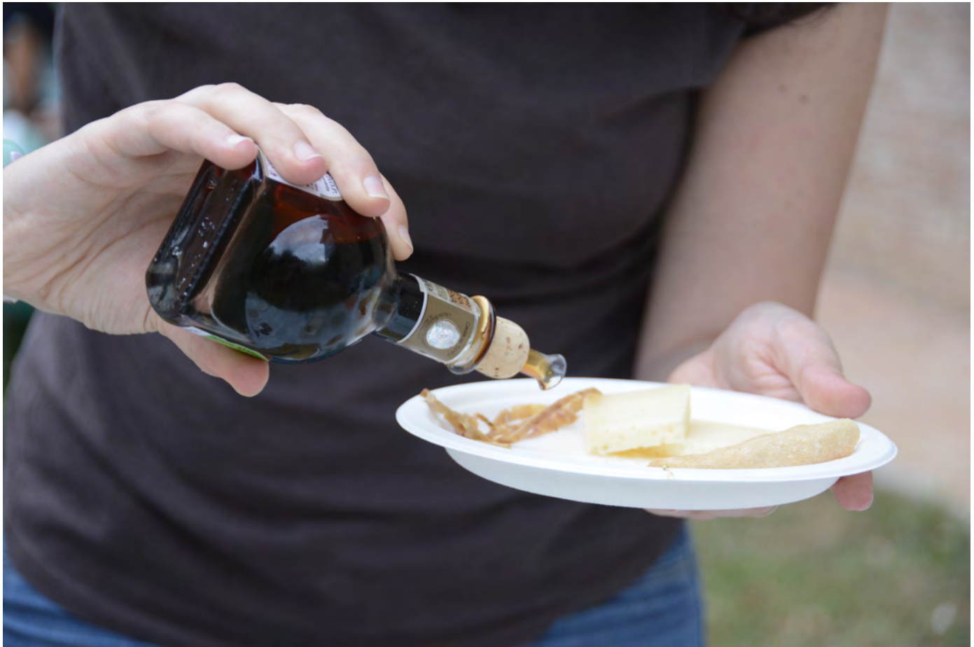
Aceto Balsamico Tradizionale di Modena anche sul pecorino. Superterra 2016