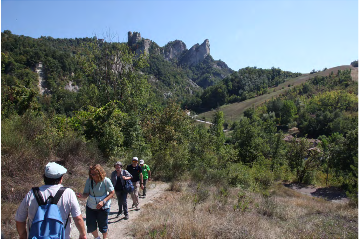
In cammino verso i Sassi di Rocca Malatina. Superterra 2017