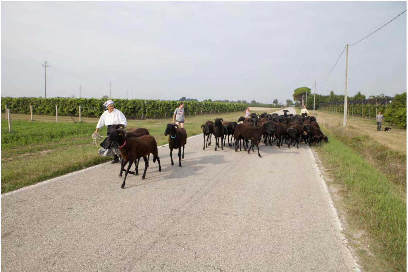
La transumanza rivive nella strada di Bastia a Ravenna, 2019