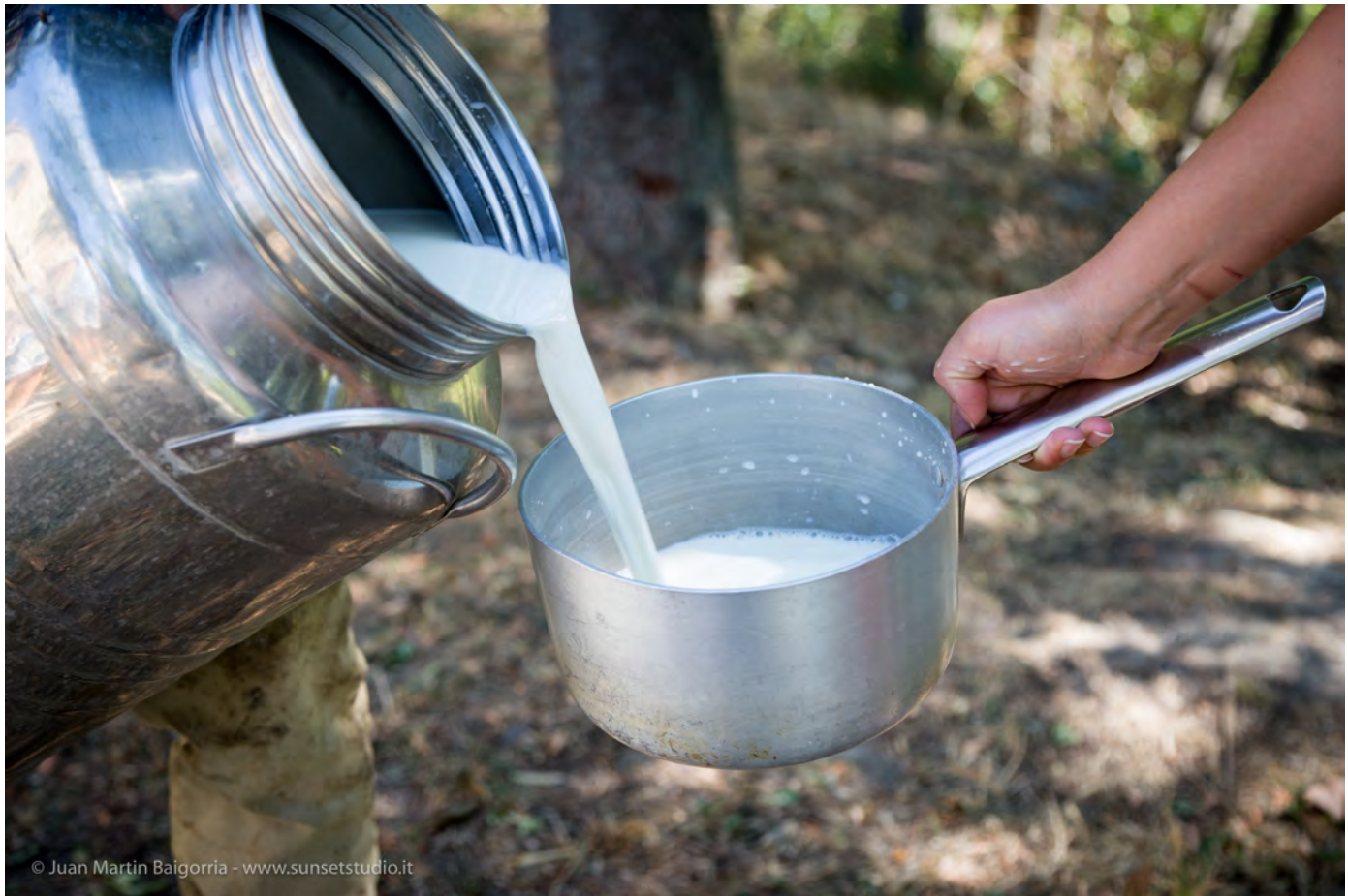
Latte di capra appena munto. Superterra 2016