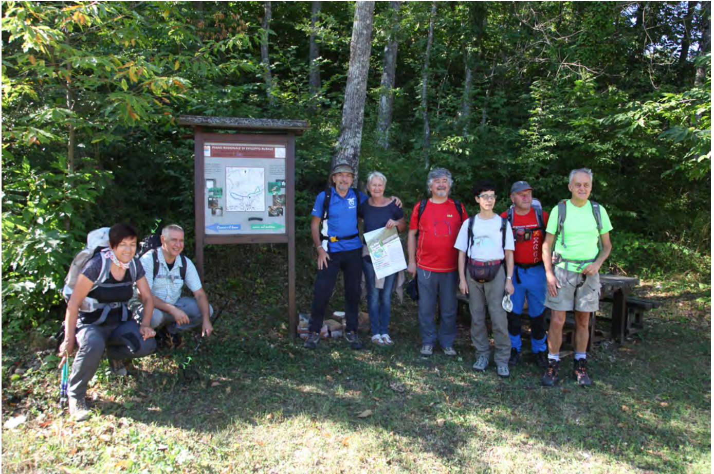
Corniglio. Superterra 2016