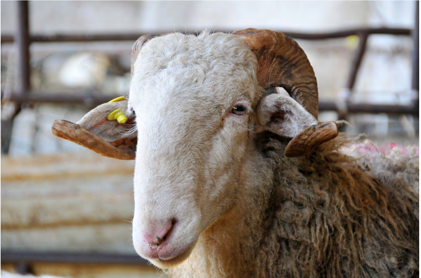
Cornella bianca