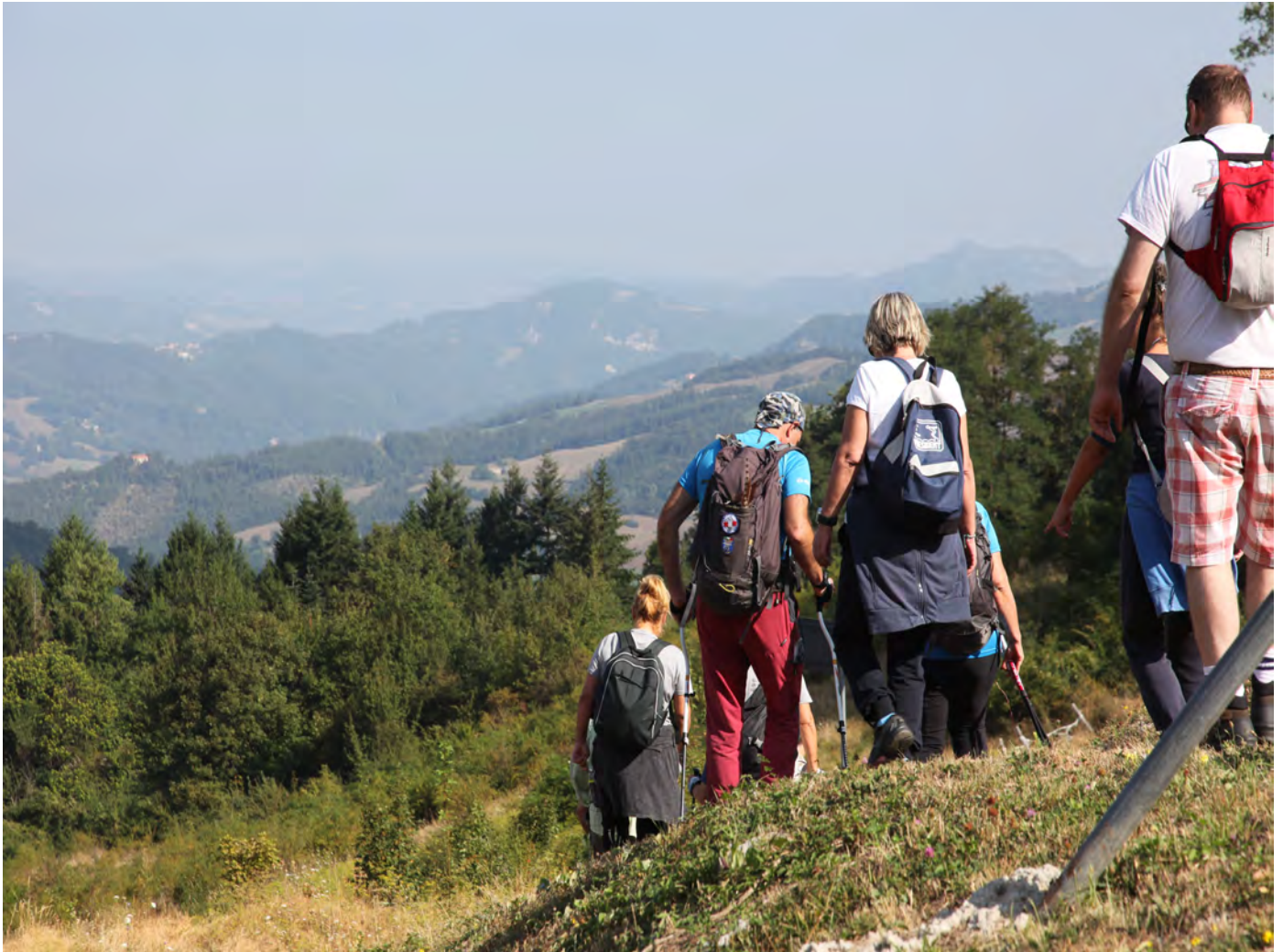
Colli bolognesi. Superterra 2016