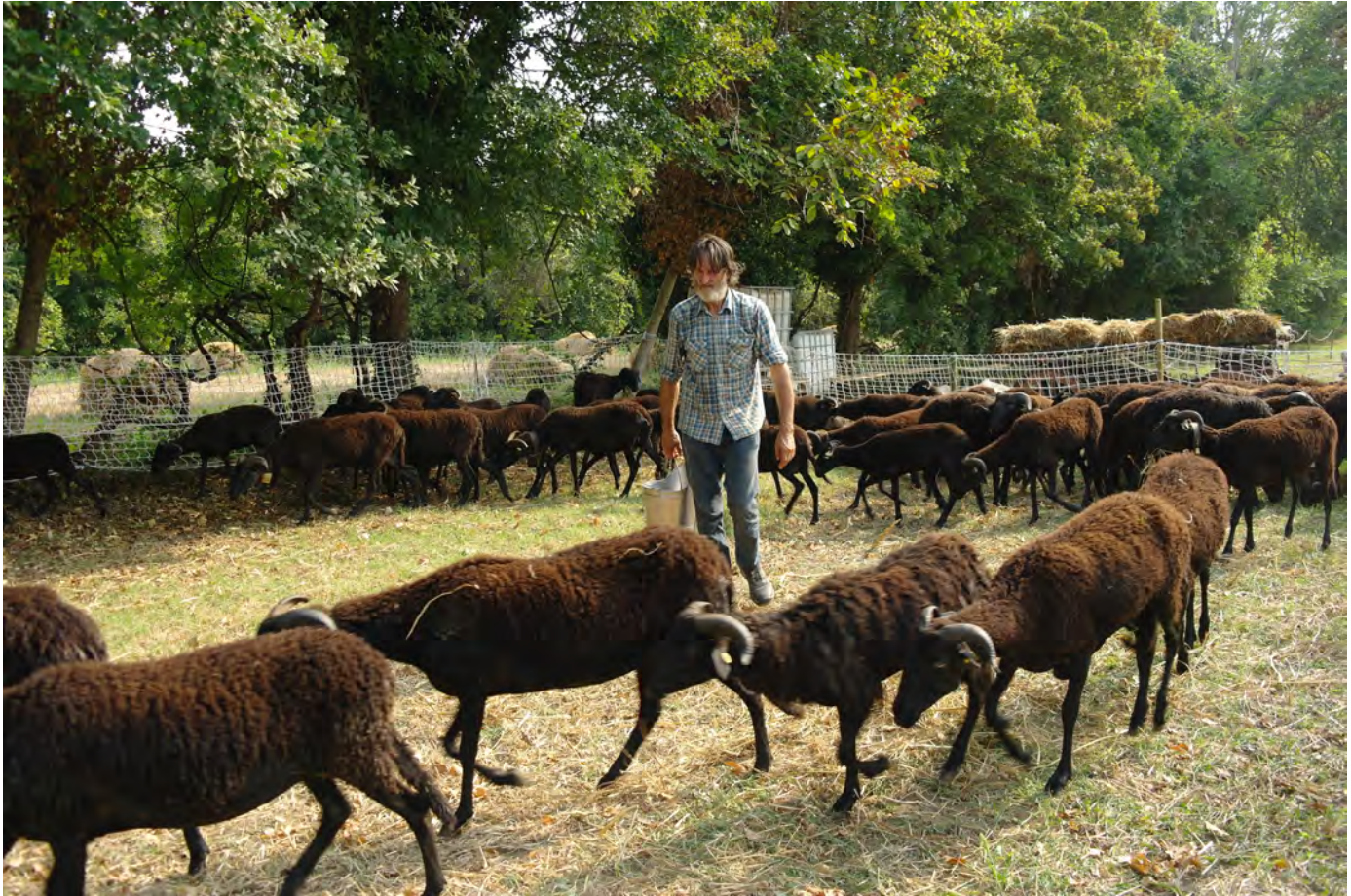
Gregge di massesi alla rete, Bastia 2019