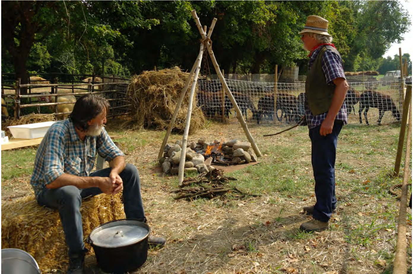
L'angolo della pastorizia transumante ricreato a Bastia: in attesa che il latte cagli, 2019