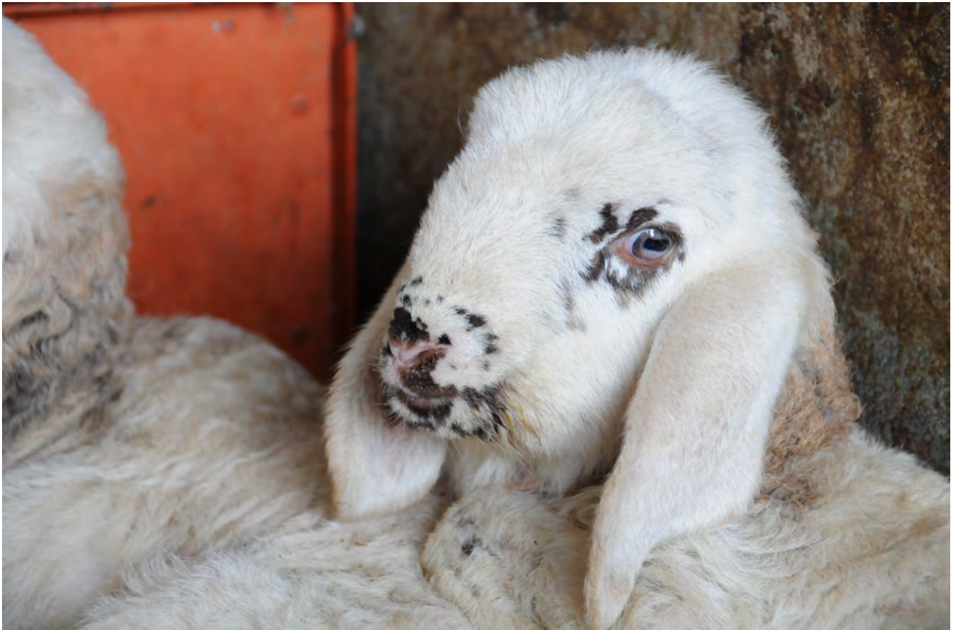
Agnello di cornigliese