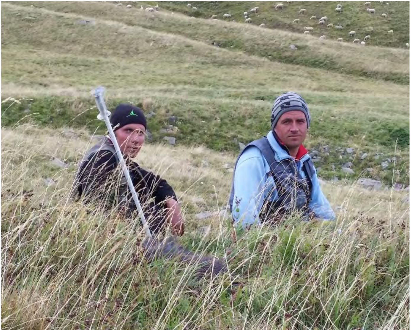
Pastori rumeni sul Monte Cusna - Appennino reggiano, 2015. Viaggio verso Expo 2015